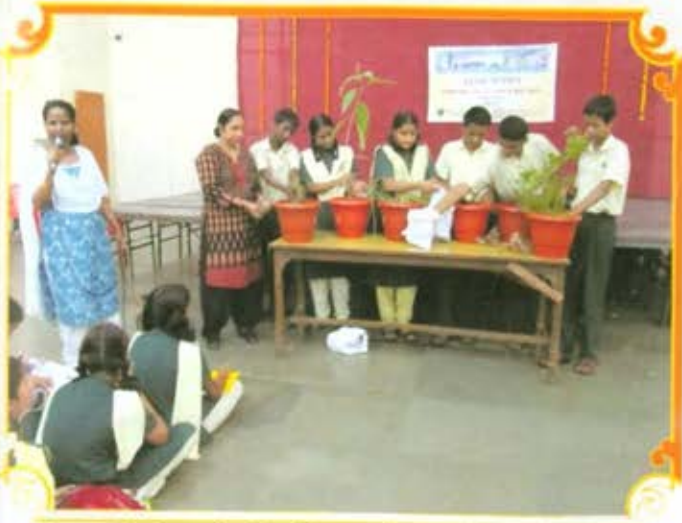
मुंबई महापालिकेतील शाळेमध्ये वसुंधरा पर्यावरण सर्वर्धन अभियाना अंतर्गत आयोजित कार्यशाळेत सहभागी विद्यार्थी