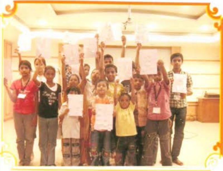
यशवंतराव चव्हाण केंद्रातील 'सृजन' या उपक्रमात सहभागी शाळकरी मुले. (मुंबई)