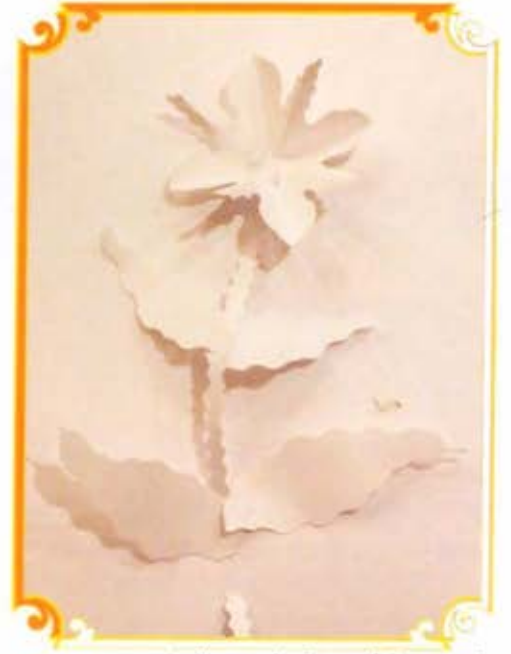
'सृजन' बाल आनंद मेळाव्यातील विद्यार्थ्यांची कलाकृती