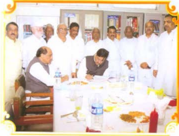
विभागीय केंद्र, कराड - मा. कार्यालयात मा. मुख्यमंत्री पृथ्वीराज चव्हाण यांनी सदृच्छा भेट दिली. सोबत मा. माणिकराव ठाकरे.