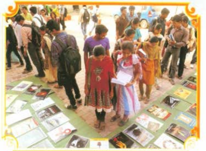
देवगिरी कला महाविद्यालय, औरंगाबाद येथे दि. २९ सप्टेंबर रोजी आयोजित जागर हा जाणिवांचा महाविद्यालयीन संवाद कार्यक्रमात स्त्रीभ्रूणहत्येविरोधाने जनजागृती करणारे पोस्टर्स