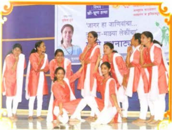
विभागीय केंद्र, औरंगाबाद - 'जागर हा जाणिवांचा' खुली पथनाट्य स्पर्धेमध्ये श्रेयनगर महिला मंडळातील कलाकार पथनाट्य सादर करताना.